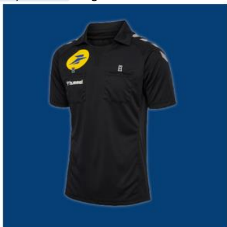
Maillot arbitre - Homme - Noir 27,47 € au lieu de 54,95€ (-50%)

Profitez d'offres & de remises exceptionnelles sur une sélection de produits « arbitrage » proposées par nos partenaires HUMMEL (fournisseur officiel & partenaire des arbitres) et CENTRAL'HAND. Pendant le mois de Décembre, profitez de promotions exceptionnelles allant jusqu'à -50% de réduction sur une sélection d'articles spécial arbitrage !