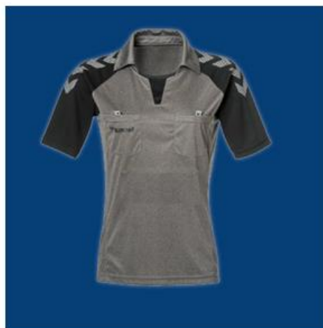
Maillot arbitre - Homme - Noir 36€ au lieu de 60€ (-40%)

Retrouvez toutes les offres de fin d'année ici > Jusqu'à -40% chez Central'Hand