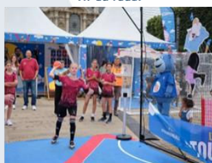
Tir au radar

Les participants se mesurent les uns aux autres en comparant cette fois-ci leur vitesse de tir ! La vitesse s'affiche sur le radar !