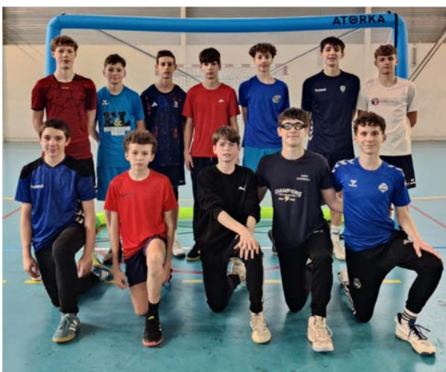
Photos prises lors de la matinée de détection du 18 février