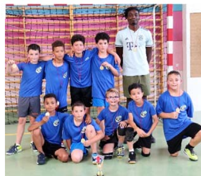
USDV - vainqueur U11M