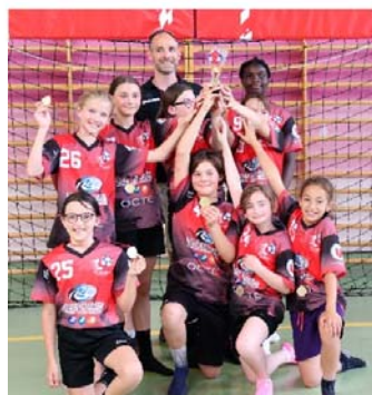
AST - vainqueur U11F