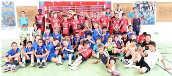
U11 Filles et Garçons