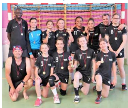
CHBA - vainqueur U13F