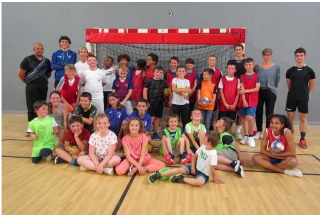
Les jeunes et es encadrants ont passé une bonne après-midi.