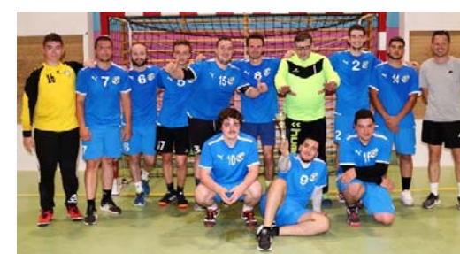
USDV – finaliste Coupe 28 M