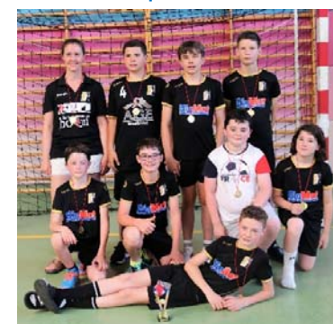
AE - vainqueur U13M