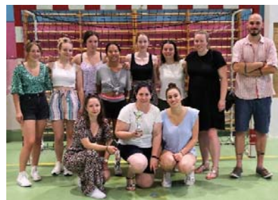
FJC – finaliste Coupe 28 F