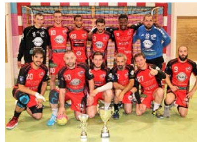
AST – vainqueur Coupe 28 M