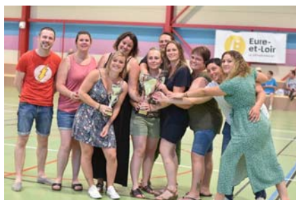
UPI – vainqueur Coupe 28 F