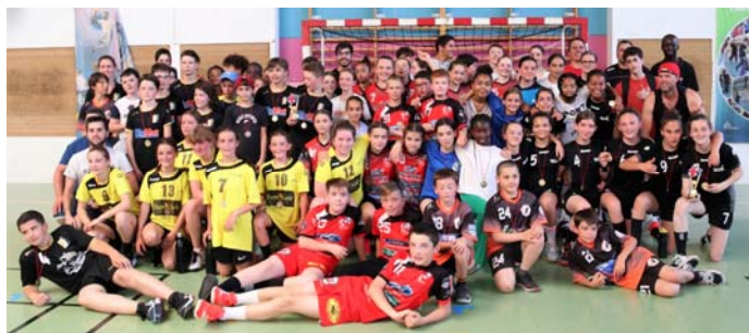
U13 Filles et Garçons

Le Comité d'Eure-et-Loir adresse ses remerciements aux dirigeants et aux bénévoles du club VOVES HB pour l'organisation de ces finalités.