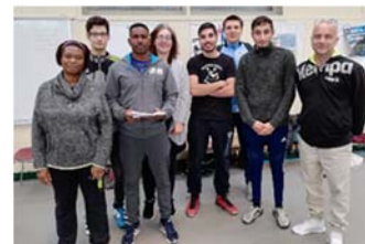
Les joueurs du CED