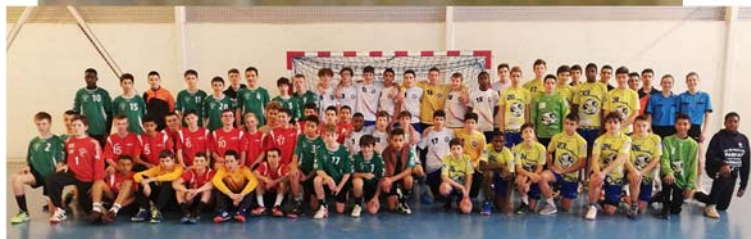
Stage 2006/2007 - Février 2020