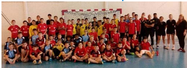
Coupe de l'Avenir -15 - Octobre 2019